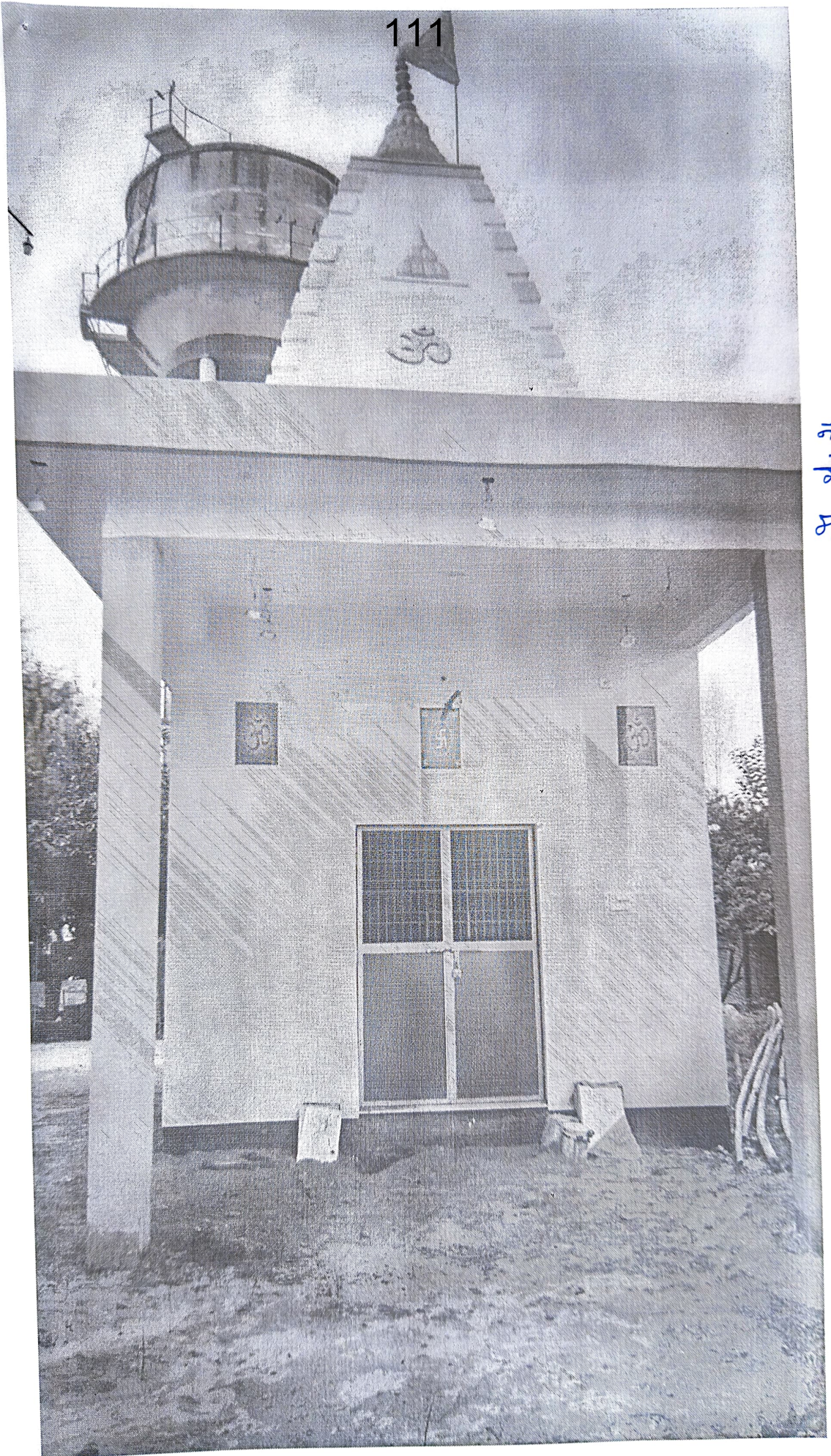
नवनिर्मित मंदिर मधुर इन्क्लेव